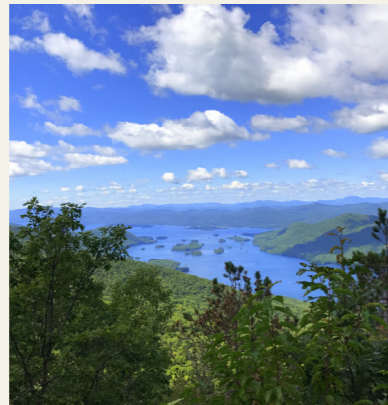
Lake George Area