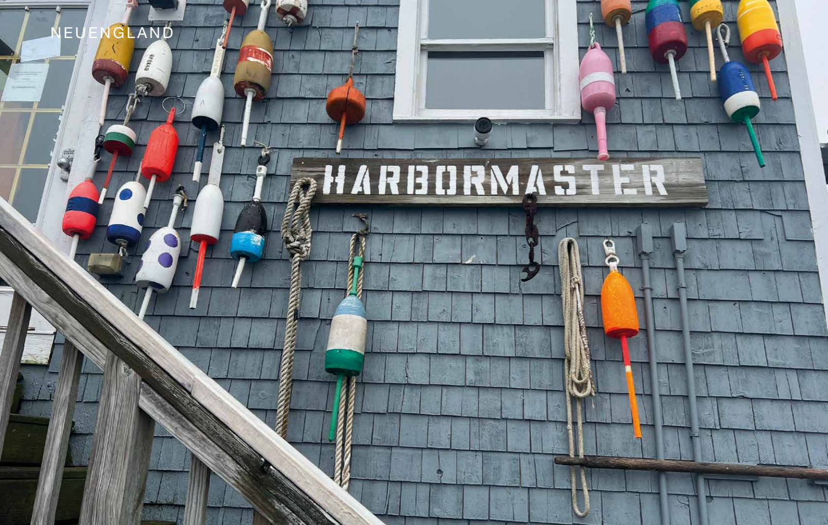
Oben: Hafenmeisterei. Rechts: Braumeister in den White Mountains.

das es bezüglich Farbe und Konsistenz fast mit Maple Syrup aufnehmen kann. Wonniger wird das Frühjahr in New England kaum.