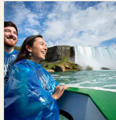
Niagara Falls, USA