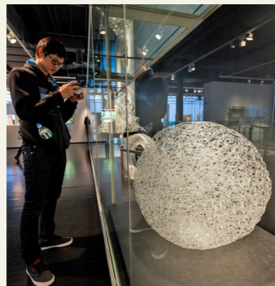
Corning Museum of Glass