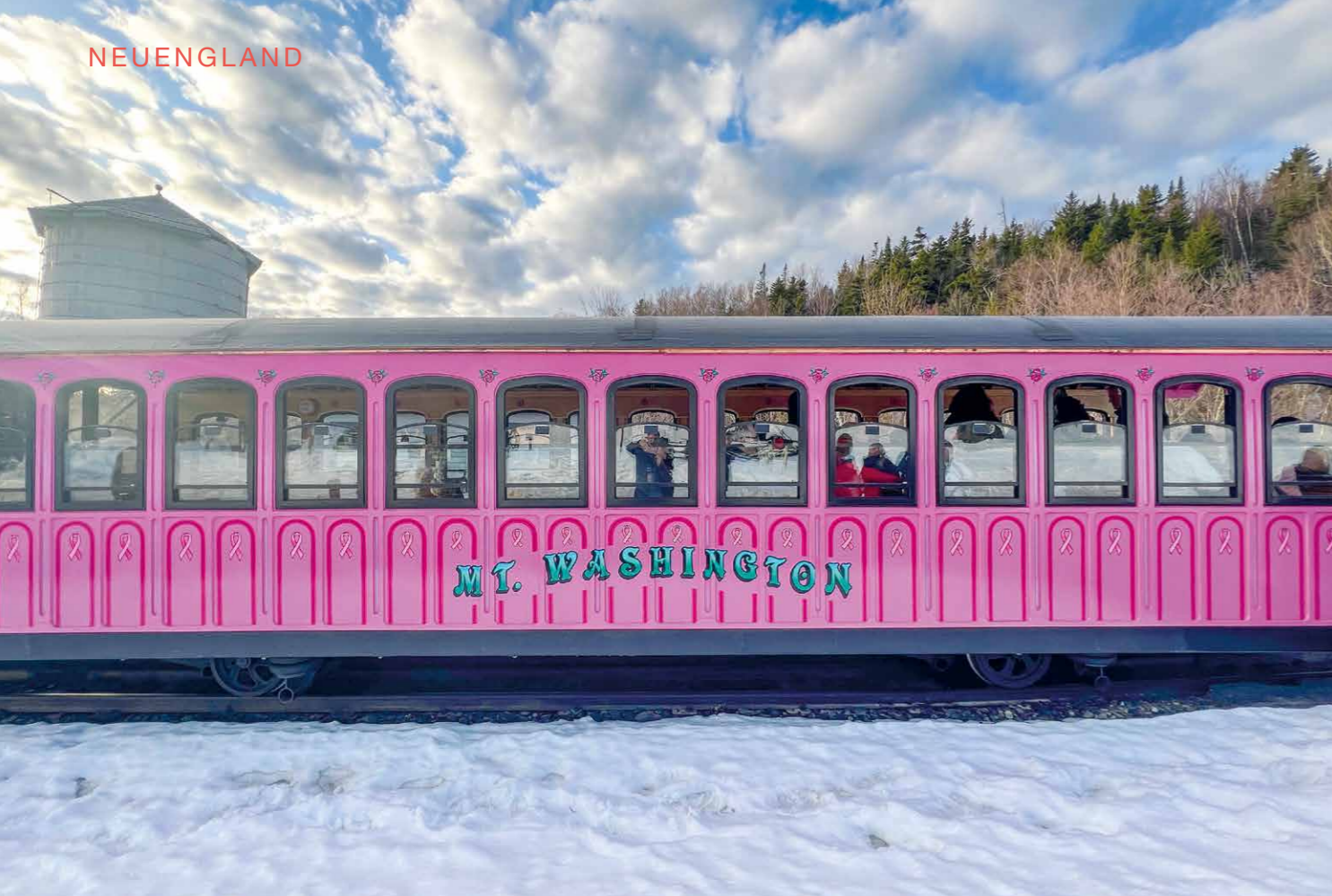
Oben: Mount Washington Cog Rail, New Hampshire. Links: Union Oyster House, Boston.