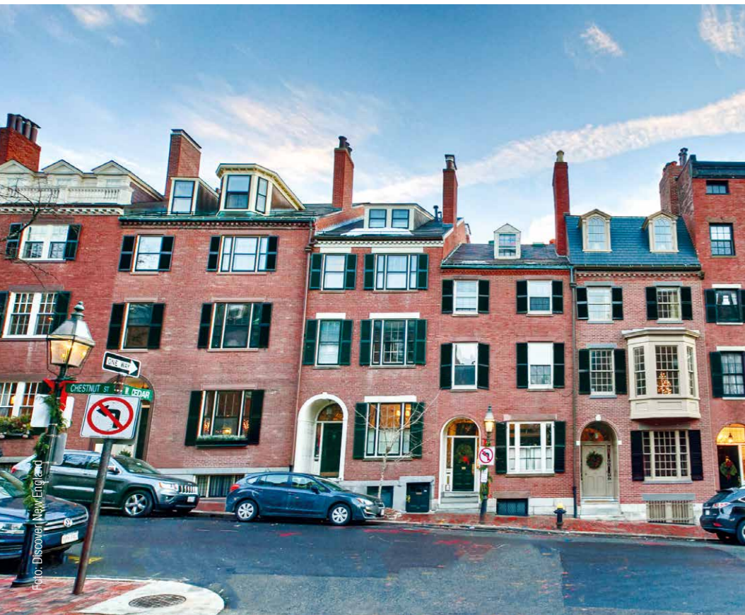
Noble Adresse: Beacon Hill in Boston.

Mit einem Jahresvorrat Ahornsirup im Kofferraum geht es weiter in